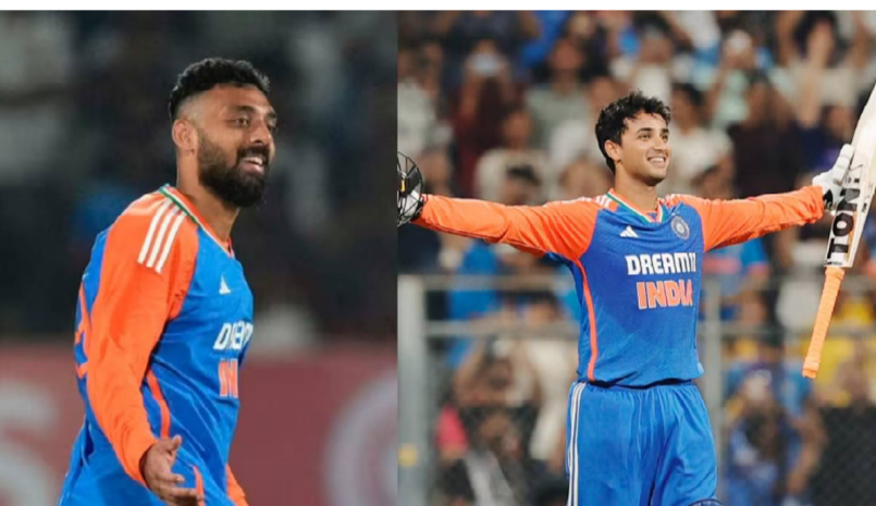
అంతర్జాతీయ క్రికెట్ మండలి (ఐసీసీ) విడుదల చేసిన తాజా టీ20 ర్యాంకింగ్ లో భారత అటాకర్లు తమ ఆధిపత్యాన్ని కొనసాగించారు. బ్యాట్లర్ జాబితాలో భారత యువ ఓపెనర్ అభిషేక్ శర్మ అగ్రస్థానాన్ని నిలబెట్టుకోగా, బౌలర్ల విభాగంలో

వరుణ్ చక్రవర్తి నంబర్ వన్ స్థానంలో కొనసాగుతున్నాడు. మరోవైపు జింబాబ్వే కెప్టెన్ సికండర్ రజా ఆల్ రౌండ్లర్ల జాబితాలో అగ్రస్థానాన్ని దక్కించుకున్నాడు. బ్యాట్లర్ల జాబితాలో అభిషేక్ శర్మ 90.9 పాయింట్లతో తొలి స్థానంలో నిలిచాడు. ఇంగ్లండ్ అటాకర్ ఫిల్ సాల్ట్ రెండో స్థానంలో, పాకిస్థాన్ బ్యాటర్ సాహిబ్ బాద్ షాన్ స్థానంలో కొనసాగుతున్నారు. భారత వికెట్ కీపర్ ఇషాన్ కిషన్ ఏడు స్థానాలు మెరుగుపరుచుకుని 25వ ర్యాంకుకు చేరుకోవడం విశేషం. బౌలర్ల విభాగంలో వరుణ్ చక్రవర్తి అగ్రస్థానంలో కొనసాగుతుండగా, పాకిస్థాన్ బౌలర్ అబ్రార్ అహ్మద్ రెండో స్థానంలో ఉన్నాడు. శ్రీలంక ఆల్ రౌండ్లర్ వనిందు హసారంగ ఒక స్థానం ఎగజాకి బలో ర్యాంకుకు చేరాడు. భారత పేసర్ అర్షద్ షిక్ సింగ్ మూడు స్థానాలు మెరుగుపరుచుకుని 11వ స్థానంలో నిలిచాడు. టీ20 ప్రపంచకప్ లో ఓపెన్ పై అద్భుత ప్రదర్శన చేసిన జింబాబ్వే కెప్టెన్ సికండర్ రజా, పాకిస్థాన్ అటాకర్ సైమ్ అయూబ్ ను వెనక్కి నెట్టి ఆల్ రౌండ్లర్ల జాబితాలో తిరిగి నంబర్ వన్ స్థానాన్ని కైవసం చేసుకున్నాడు. బౌలింగ్ లో కట్టుదిట్టంగా రాణించడంతో పాటు బ్యాటింగ్ లోనూ జట్టుకు కీలక పాత్ర పోషించిన రజా మరోసారి తన సామర్థ్యాన్ని చాటుకున్నాడు.