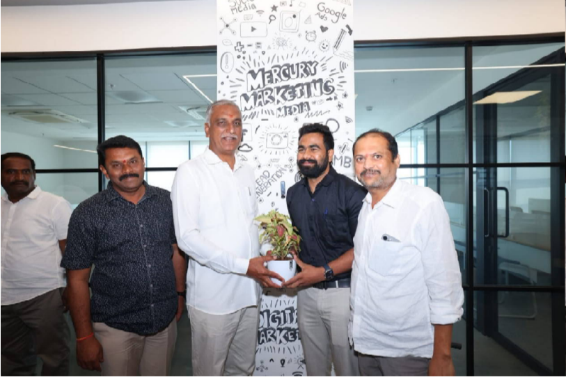
సిద్దిపేట, ఫిబ్రవరి 11 నేటిపత్రిక ప్రజాసీమ: సిద్దిపేటలో ఏర్పాటు చేసిన ఐటీ టవర్ స్థానిక యువతకు ఉద్యోగావకాశాలు కల్పించాలనే లక్ష్యంతోనే నిర్మించామని

మాజీ మంత్రి, ఎమ్మెల్యే హరీష్ రావు తెలిపారు. బుధవారం ఆయన ఐటీ టవర్ను సందర్శించి అక్కడ పని చేస్తున్న యువతతో ముచ్చటించారు. ఐటీ టవర్లో కల్పిస్తున్న సౌకర్యాలు, కంపెనీల పనితీరు, ఉద్యోగుల సమస్యలపై సమగ్రంగా ఆరా తీశారు. సిద్దిపేటలోనే చదువుకుని ఇక్కడే ఉద్యోగాలు సాధించాలనే యువత ఆకాంక్షను నెరవేర్చేందుకు గత ప్రభుత్వ హయాంలో ఐటీ టవర్ను ఏర్పాటు చేసినట్లు హరీష్ రావు గుర్తుచేశారు. ప్రస్తుతం ఐటీ టవర్లో 17 సంస్థలు కార్యకలాపాలు నిర్వహిస్తున్నాయని, సుమారు 350 మంది యువత ఉపాధి పొందుతున్నారని తెలిపారు. అదేవిధంగా సిద్దిపేటలో నైపుణ్యాభివృద్ధి కోసం టాస్క్ శిక్షణ కేంద్రాన్ని కూడా ఏర్పాటు చేసి నిరంతరం శిక్షణ కార్యక్రమాలు నిర్వహిస్తున్నామని పేర్కొన్నారు. పర్యటన సందర్భంగా భద్రతా సిబ్బంది మరియు ఇతర కార్యకర్తలకు జీతాలు అలస్యంగా చెల్లిస్తున్నారన్న ఫిర్యాదులు రావడంతో వెంటనే సంబంధిత అధికారులతో మాట్లాడి జీతాలు చెల్లించాలని ఆదేశించారు. ఐటీ టవర్లోని నాలుగు అంతస్తులను పరిశీలించిన ఆయన, యువత స్థానికంగానే ఉపాధి పొందేలా మరిన్ని సంస్థలను తీసుకురావాలని సూచించారు. స్థానిక యువత నైపుణ్యాలను మెరుగుపరచుకుని ఈ అవకాశాలను సద్వినియోగం చేసుకోవాలని హరీష్ రావు పిలుపునిచ్చారు.