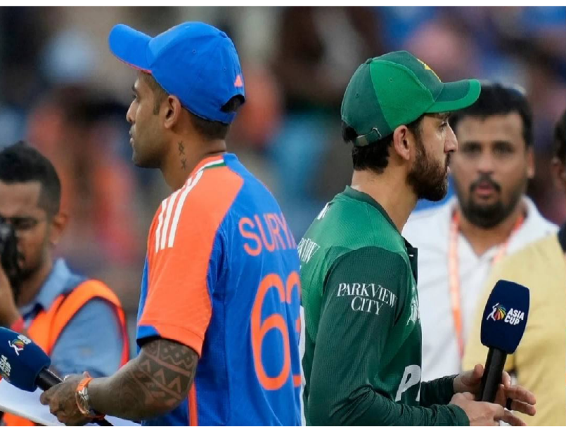
టీ20 ప్రపంచకప్ లో భాగంగా ఈ నెల 15న కొలంబో వేదికగా భారత్, పాకిస్థాన్ మధ్య జరిగే హై వోల్టేజ్ మ్యాచ్ ప్రభావం ప్రయాణ రంగంపై స్పష్టంగా కనిపిస్తోంది. ఈ మ్యాచ్ ను ప్రత్యక్షంగా వీక్షించేందుకు అభిమానులు భారీగా

కొలంబోకు వెళ్లేందుకు సిద్ధమవుతుండటంతో విమాన టిక్కెట్ ధరలు అమాంతం పెరిగాయి. ముంబై--కొలంబో--ముంబై రూట్ లో విమాన టిక్కెట్ ధర నిన్ను ఉ దయం రూ.60,000గా ఉండగా, ప్రస్తుతం మరింత పెరిగినట్లు సమాచారం. ముంబై నుంచి కొలంబోకు ఎకానమీ క్లాస్ టిక్కెట్ ధర సుమారు రూ.60,000 ఉండగా, ప్రీమియం ఎకానమీ ధర రూ.84,000 వరకు చేరుకుంది. శ్రీలంక ఎయిర్ లైన్స్ లో బిజినెస్ క్లాస్ టిక్కెట్లు రూ.1.34 లక్షల వరకు పలుకుతున్నాయి. సాధారణంగా రూ.30,000 పరిధిలో ఉండే డిప్లీ--కొలంబో టిక్కెట్ ధర ప్రస్తుతం రూ.90,000కు పెరగడం గమనార్హం. బిజినెస్ క్లాస్ టిక్కెట్ ధరలు రూ.1.92 లక్షల నుంచి రూ.2.25 లక్షల వరకు చేరుకున్నాయి. భారత్--పాక్ మ్యాచ్ పై భారీ ఆసక్తి ఉండటంతో డిమాండ్ ఒక్కసారిగా పెరగడం దీని ప్రధాన కారణంగా చెబుతున్నారు. మొదట భారత్ తో మ్యాచ్ ఆడబోమని ప్రకటించిన పాకిస్థాన్ క్రికెట్ బోర్డు, పలు దఫాల చర్చల అనంతరం మ్యాచ్ కు అంగీకరించడంతో అభిమానుల్లో ఉత్కంఠ మరింత పెరిగింది. దీంతో విమాన టిక్కెట్లతో పాటు కొలంబోలో హోటల్ ధరలు కూడా భారీగా పెరిగాయి. ఫిబ్రవరి 14, 15 తేదీల్లో శ్రీ స్టార్, ఫైవ్ స్టార్ హోటళ్లలో డబుల్ టెడ్ రూమ్ ధరలు రూ.1.05 లక్షల నుంచి రూ.1.06 లక్షల వరకు ఉండగా, సాధారణ రోజుల్లో ఇవి రూ.40,000 నుంచి రూ.50,000 మధ్యలోనే ఉంటాయి.