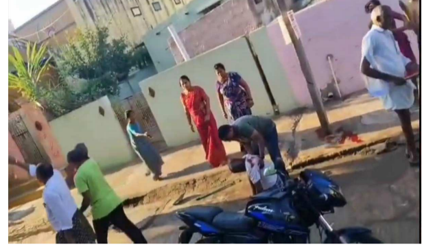
రాజంపేట (ప్రజా సీమ) రాజంపేట మండలం ఊటుకూరులో కత్తులు కట్టలతో అయిదుగురు యువకులు