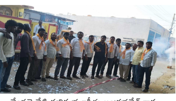
వేంపల్లె నేటి పత్రిక ప్రజాసీమ: ఆంధ్రప్రదేశ్ రాష్ట్ర శాస్త్రవేత్త రాజధానిగా అమరావతికి చట్టబద్ధత