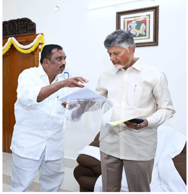
ఒంటిమిట్ట, (ప్రజా సీమ) : కోదండ రాముని కళ్యాణానికి విచ్చేసి ఒంటిమిట్ట దేవస్థానం గెస్ట్ హౌస్ నందు ఉన్న రాష్ట్ర ముఖ్యమంత్రి నారా చంద్రబాబు నాయుడు ని కలిసి ఒంటిమిట్ట అభివృద్ధికి నోచుకోవడానికి ఒంటిమిట్ట దేవాలయానికి వరమడ వీధి పోటు (కడప నుండి