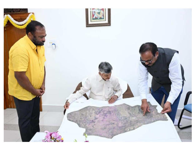
ఒంటిమిట్ట, (ప్రజా సీమ) : తిరుమల లాగా ప్రసద్ది చెందేలా ప్రముఖ పుణ్యక్షేత్రంగా ఒంటిమిట్టను తీర్చిదిద్దేందుకు సమగ్ర ప్రణాళికలు రూపొందించాలని ముఖ్యమంత్రి చంద్రబాబునాయుడు ఆదేశించారు. గురువారం నాడు ఒంటిమిట్ట స్టేట్ గెస్ట్ హౌస్ నందు నియోజకవర్గ ఇన్చార్జ్,